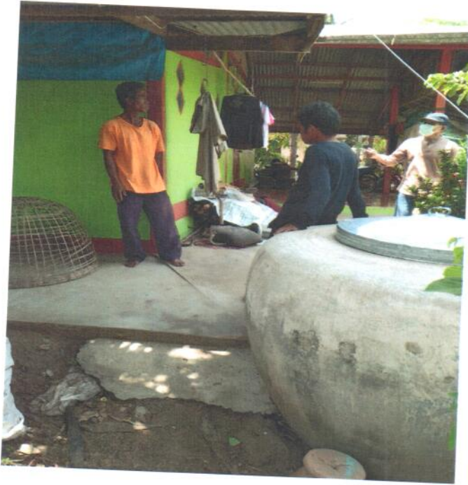
ภาพการแก้ไขปัญหาเหตุรำคาญ (น้ำเสีย)